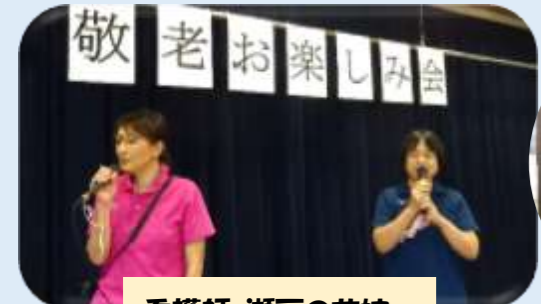
看護師 瀬戸の花嫁