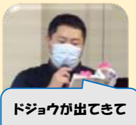
ドジョウが出てきて こんにちは〜♪