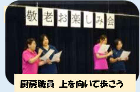
厨房職員 上を向いて歩こう

九月二十一日、敬老お楽しみ会を催し、職員で色々な出し物をして盛り上げました。昼食は敬老祝い膳を囲みお祝いをしました。