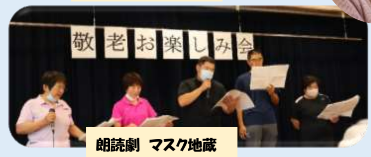
朗読劇 マスク地蔵