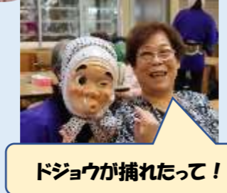
ドジョウが捕れたって!