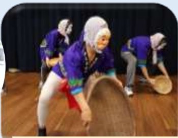
支援員 ドジョウすくい