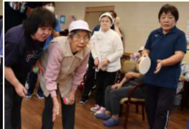
ストラックアウト