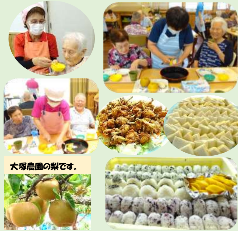
大塚農園の梨です。

楽しみにしていた梨狩りが中止になり、お腹いっぱい梨を食べる事が出来なくて残念と話がありました。そこで、沢山の梨とおにぎり弁当を準備してお楽しみ昼食会を催しました。「皮をむいたらそのまま食べたい」という方もいて梨を美味しく頂くに、頑張っていました。お弁当も皆さんに好評でした。